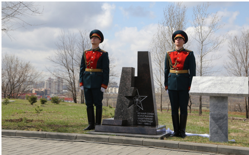
Открытие памятника павшим героям-вологжанам – защитникам города Сталинграда (г. Волгоград, 2015 г.).

Особенно памятным было открытие памятника погибшим вологжанам на Мамаевом Кургане в городе Волгограде (20 апреля 2015 г.), который был изготовлен на всенародно собранные пожертвования граждан.