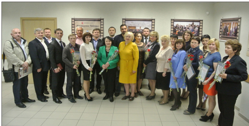
Фотовыставка «Наследники Победы» (май 2015 г.)

Дополнением к информационному освещению деятельности ОП (кроме сайта, СМИ) решением Совета по согласованию с собственником здания – Правительством Вологодской области – часть помещений в фойе 2 этажа по адресу: улица Герцена, д. 27 используется в стабильном режиме проведения выставочной деятельности. Причем, тематика выставок разнообразна: посвященная I-ой мировой войне, 70-летию Победы в Великой Отечественной войне, фотоколлаж областных НКО. В организации выставок участвуют сотрудники Архивов Вологодской области, представители НКО и бизнессообщества. Примечательно, что зал заседаний и помещения Общественной палаты регулярно используются различными структурами и категориями населения, что обеспечивает постоянное массовое ознакомление с выставочными материалами, представленными по планам работы.