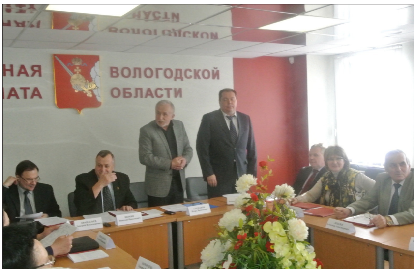
Расширенное заседание Совета Общественной палаты Вологодской области (10 марта 2015 г.)

2) На основе анализа итогов экспертной оценки в 2013 году были сформулированы позитивные и негативные аспекты подготовки и проведения публичных отчетов, структуры и содержания оценочной анкеты для эксперта. После заинтересованной дискуссии с членами Наблюдательного совета, руководством Департамента государственной службы и кадровой работы – ответственного за реа-