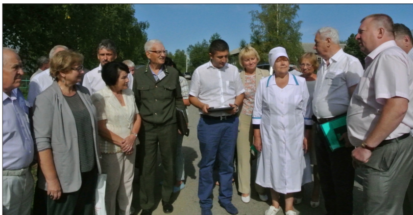
Выездное расширенное заседание Совета Общественной палаты Вологодской области на базе Кирилловского муниципального района (22 июля 2014 г.)

Показателен пример обсуждения проекта бюджета области на очередной финансовый год. Так из 12 предложений в бюджет 2014 года принятых в форме рекомендаций пленарным заседанием ОП Вологодской области (26.11.2013 года) были включены и выполнены 11. В условиях жесткого лимитирования бюджетных средств в 2015 году актуальными для исполнения остаются все рекомендации ОП Вологодской области, принятые на пленарном заседании 23.12.2014 года. Позитивную роль в бюджетном планировании и исполнении бюджета играет ежегодная письменная информация Департамента финансов об исполнении рекомендаций ОП Вологодской области. Кроме того, через организованные возможности Общественного совета Департамента стратегического планирования, других структурных подразделений Правительства, а также системное взаимодействие с Комитетом по бюджету и налогам и другими Комитетами Законодательного Собрания области, члены ОП Вологодской области оказывают влияние на принимаемые нормативно-правовые акты в сфере стратегического планирования социально-экономического развития области, проектов областных государственных программ.