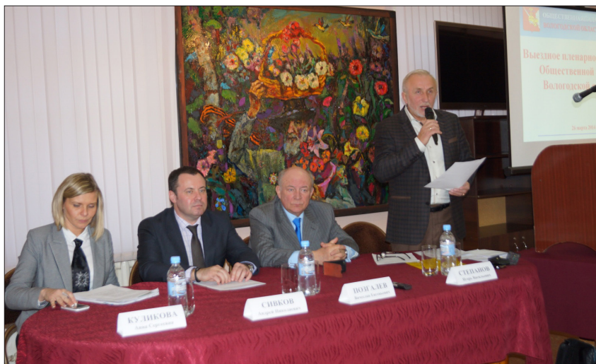
Выездное пленарное заседание Общественной палаты Вологодской области в Доме Корбакова (26 марта 2014 г.)

4. Совместные мероприятия ОП с Клубом фронтовых друзей стали доброй традицией. Клуб фронтовых друзей, объединяющий около 200 участников Великой Отечественной войны, работает на базе выставочного комплекса «Дом Корбакова» (г. Вологда, ул. Октябрьская, д.13) в форме ежемесячных открытых заседаний.