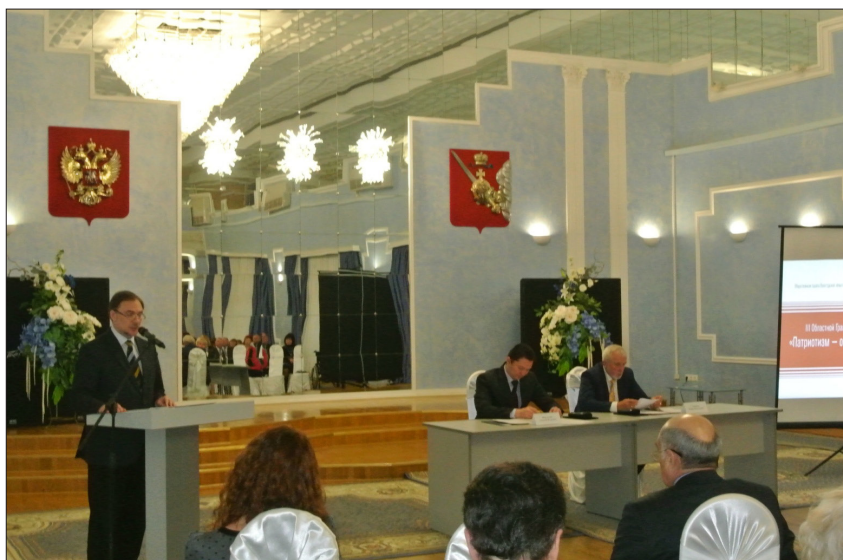
Итоговое заседание III областного Гражданского Форума «Вологодская область – Душа Русского Севера. Патриотизм как основа общественного согласия» (г. Череповец, 8 декабря 2014 г.)

Считать критериями патриотизма: Иметь семью, растить детей, быть профессионалом в своей работе, делать свое дело мастерски, жить и работать не только на удовлетворение личных потребностей, но и интересов корпоративных, общественных.