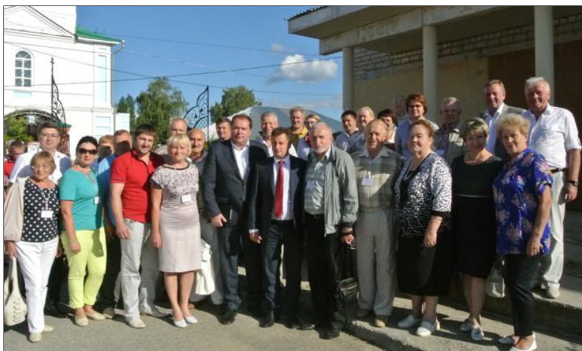
Участники выездного расширенного заседания Совета Общественной палаты Вологодской области на базе Шекснинского муниципального района (11 августа 2015 г.)

В целях повышения личной активности членов ОП Вологодской области, а также укрепления взаимодействия с Общественными