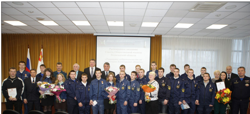
Расширенное заседание Совета Общественной палаты Вологодской области (02 декабря 2013 г.)

Общественным Советам, органам исполнительной и законодательной власти и муниципальных образований оказывать всестороннюю поддержку социально-значимых инициатив некоммерческих общественных организаций по развитию добровольчества, созданию условий для привлечения к этой работе широких слоев молодежи, реализации гражданско-патриотических проектов социально активной части жителей Вологодской области.