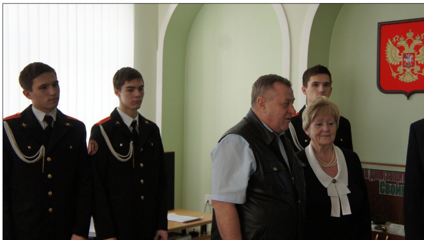
Выездное заседание МРГ по патриотическому воспитанию на базе БОУ ВО «Вологодская кадетская школа»

Положительной оценки и тиражирования опыта заслуживает практика поддержки Палатой местных гражданских инициатив. Так, Межкомиссионной рабочей группой ОП Вологодской области было поручено кадетам БОУ ВО «Вологодская кадетская школа-интернат» (г. Сокол) провести сбор и анализ предложений жителей г. Сокол, Сокольского района по значимым, с их точки зрения, проблемам и путям их решения.