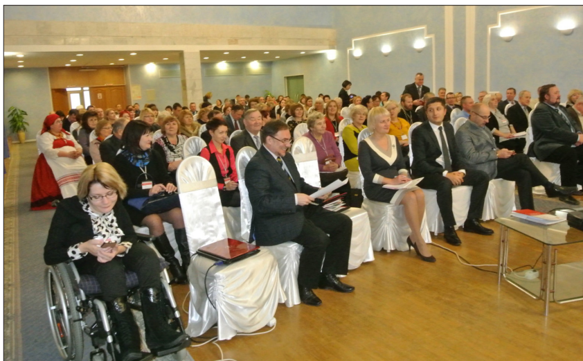
Итоговое заседание III областного Гражданского Форума (г. Череповец, 08 декабря 2015 г.)

Подготовка и проведение Гражданского Форума (08 декабря 2014 г.) уже на стадии работы секций, итогового заседания подтвердили правильность нашего решения (материалы Гражданского Форума – см. Приложение № 5 ). Позитивный резонанс данного мероприятия сохраняется в обществе в форме активности и массовости дискуссий, а также практической деятельности всех категорий населения области.