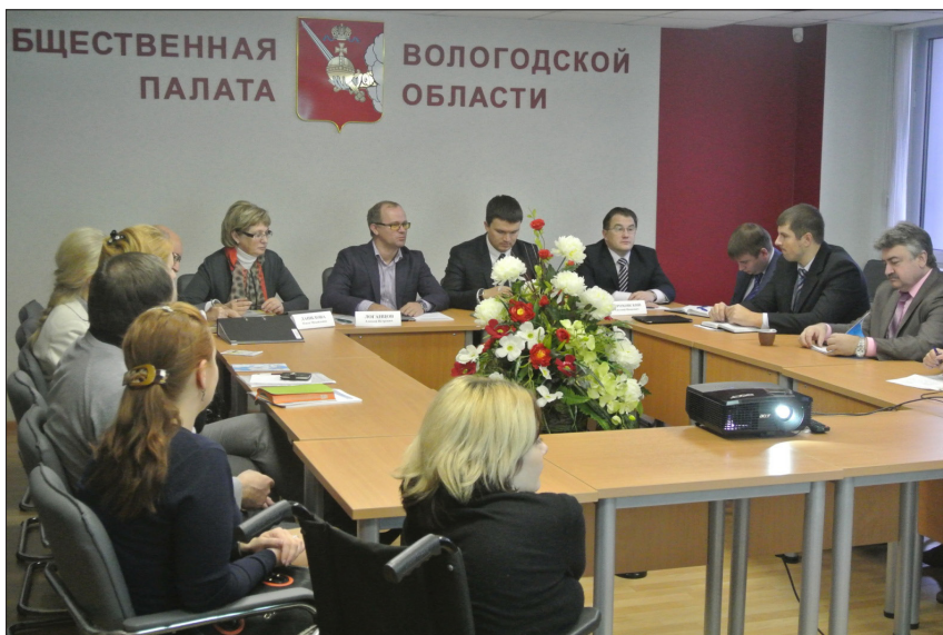
Заседание Комиссии по экономическому развитию и предпринимательству Общественной палаты Вологодской области

коррекции областных государственных целевых программ экономического развития и поддержки предпринимательства.