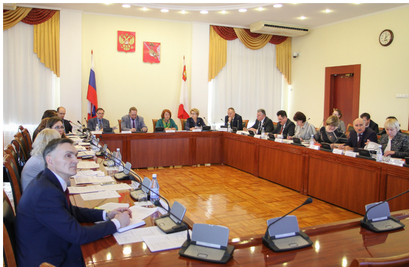
Заседание комиссий ОПВО в Законодательном собрании Вологодской области.

Комиссия по вопросам патриотизма, духовно-нравственного воспитания, межнациональным и межконфессиональным связям организовала проект «Вехи истории». В рамках этого проекта были организованы историко-документальные выставки с 1 по 16 сентября 2016 года «Святые земли Вологодской», посвященные Дню народного единства, истории российских конституций.