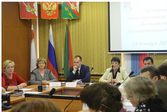
Общественный совет Вологодского района.

Проводились и другие заседания Совета, в планах еще два заседания: в ноябре и декабре.