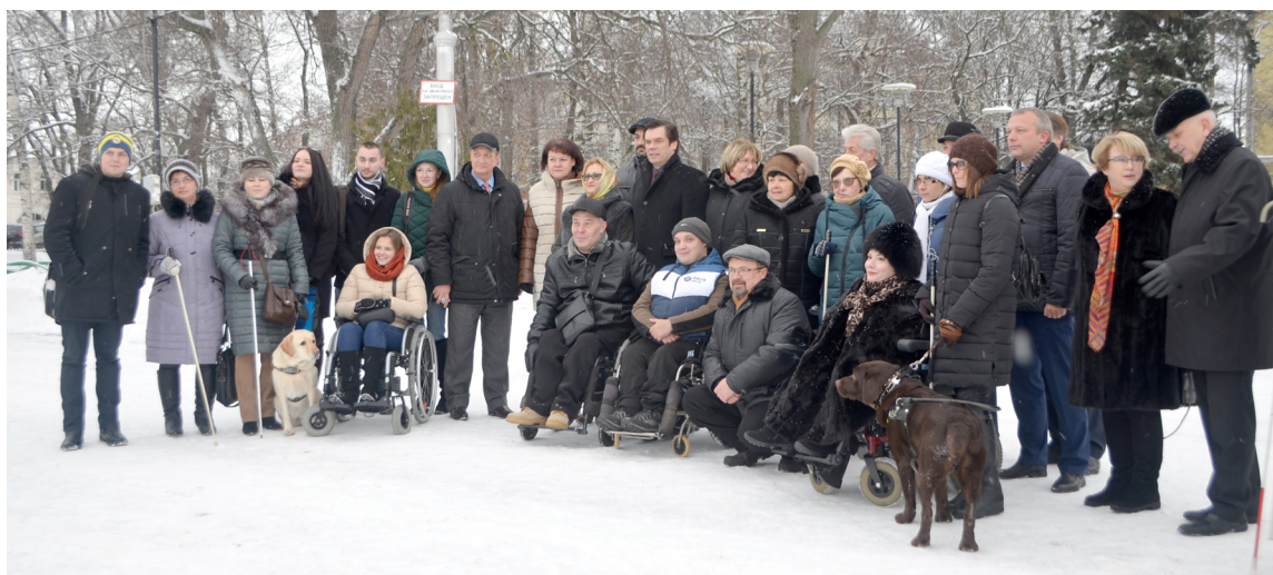
Безбарьерная среда в Вологде.

Кроме того, общественники на пленарном заседании подчеркнули, что не оставят без внимания такие темы, как организация в области детского отдыха, создание в Вологде безбарьерной среды для людей с ограниченными возможностями здоровья и даже вопрос награждения почетными грамотами глав муниципальных образований (эксперты сетовали на то, что в результате сложившейся ситуации без морального поощрения в районах остались молодые люди до 35 лет). Ну, и традиционно представители Общественной палаты намерены продолжить экспертизы принимаемых на уровне региона и муниципальных образований значимых нормативных актов. Вот только среди таких экспертов, как правило, оказываются одни и те же люди. Поэтому на заседании Общественной палаты прямо говорили о необходимости привлечения к экспертной деятельности новых лиц.