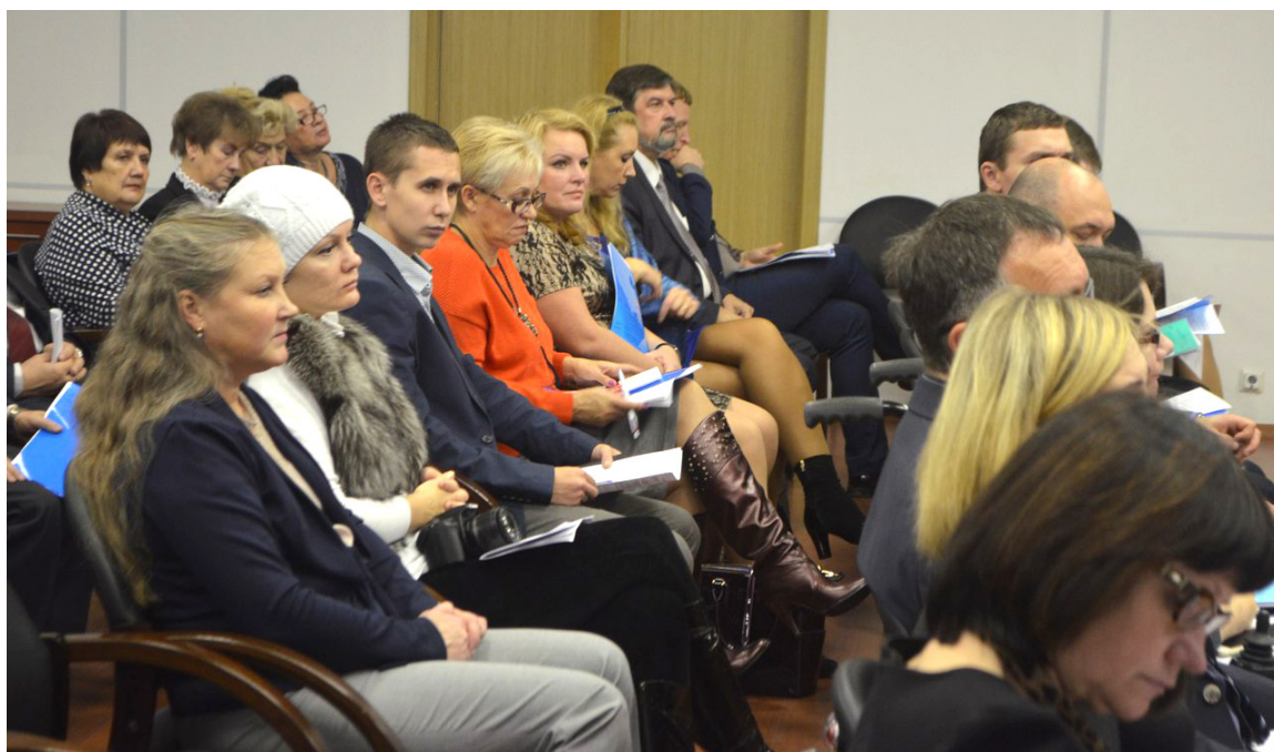
Пленарное заседание ОПВО. Тема Общественный контроль .

Если говорить более предметно о СМИ (ее функциональном назначении и «контенте») в разрезе нашей темы (общественной активности), необходимо отметить, что ОПВО ежемесячно проводит мониторинг СМИ на предмет выявления актуальных социально-экономических