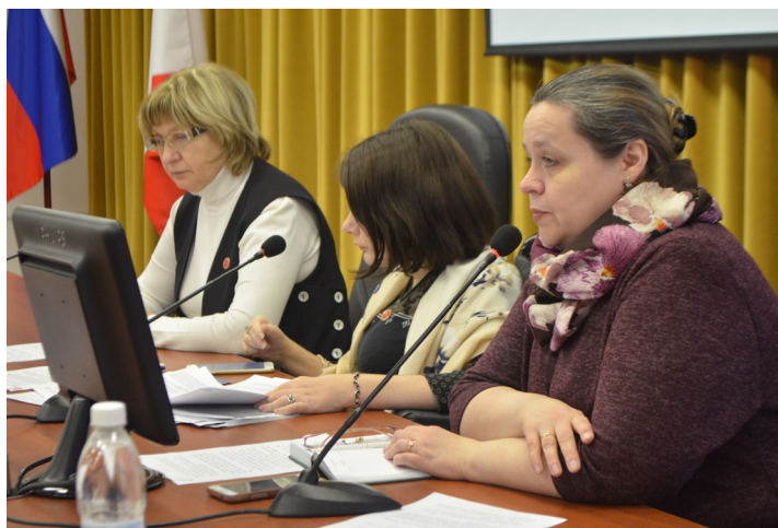
Гражданский форум в Вологде. Работа с НКО.

физических и юридических лиц, мы не решим задачу по развитию экономики Вологодской области. Наша общая задача состоит в том, чтобы создать условия для развития бизнеса, предпринимательской инициативы, промышленного роста. Также в сегодняшних условиях очень важно научиться эффективно расходовать каждый поступающий в казну бюджетный рубль. Надеюсь, что в Правительстве все это хорошо понимают».