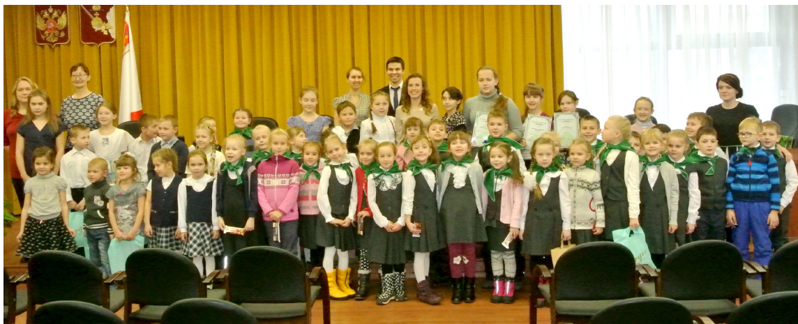
Детский конкурс рисунков на тему экологии.

Представителем этой же комиссии была проведена и встреча с членами Клуба любителей искусств 1 октября в Доме Корбакова по проблемам более широкого использования инновационных ресурсов архивов в целях противодействия фальсификации истории и патриотического воспитания населения. В ходе встречи были заданы вопросы о публикации архивных источников в настоящее время и в прошлые годы, об использовании архивных документов в социальных целях, об эффективности и результатах этой деятельности для социально-экономического и культурного развития Вологодской области. Участники встречи высказали предложение о дальнейшем взаимодействии Общественной палаты Вологодской области и картинной галереи, о продолжении подобных встреч по проблемам повышения эффективности информационных и историко-культурных ресурсов г.Вологды и области в целом в различных целях. На встрече присутствовали историки, искусствоведы, журналисты, работники культуры, ветераны труда и др.