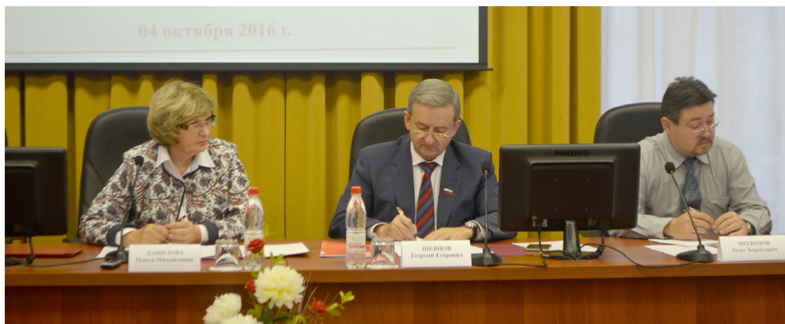
Пленарное заседание ОПВО. Тема Общественный контроль.

вопросов, вопросов культуры и здравоохранения, образования и т.д. местного и регионального уровня значения. Основными новостными операторами на территории Вологодской области являются Вологда-портал, Север-информ, МК-RU.