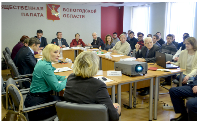
Заседание комиссии ОПВО - обсуждение экологических вопросов.

деятельности. Конкурс проводился в целях развития интеллектуально-творческого потенциала личности, воспитания бережного отношения к природе родного края. Конкурс реализовывался в рамках социального проекта «Больше кислорода» при поддержке Правительства Вологодской области . Все участники, представившие свои работы на конкурс, были отмечены благодарственными письмами, а 7 победителей - призами.