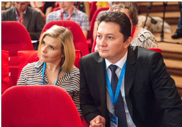
Гражданский форум в Череповце.

«В первую очередь, жителей области волнуют вопросы сферы здравоохранения. Несмотря на все принятые меры по модернизации отрасли, многим пациентам приходится