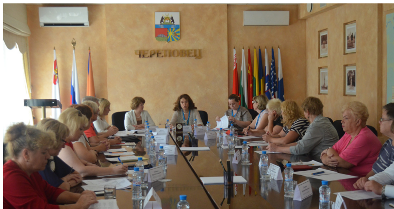
Общественный совет Череповца.

Жители МКД, оплачивая квитанции за электричество, воду и т. д., обращались в информационно-расчетный центр. Данный расчетный центр был посредником между потребителями жилищно-коммунальных услуг и РСО.