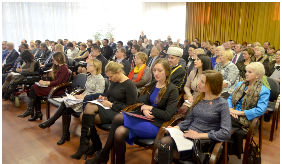
Пленарное заседание ОПВО. Проект регионального бюджета.

30 ноября 2016 года Общественная палата Воло-